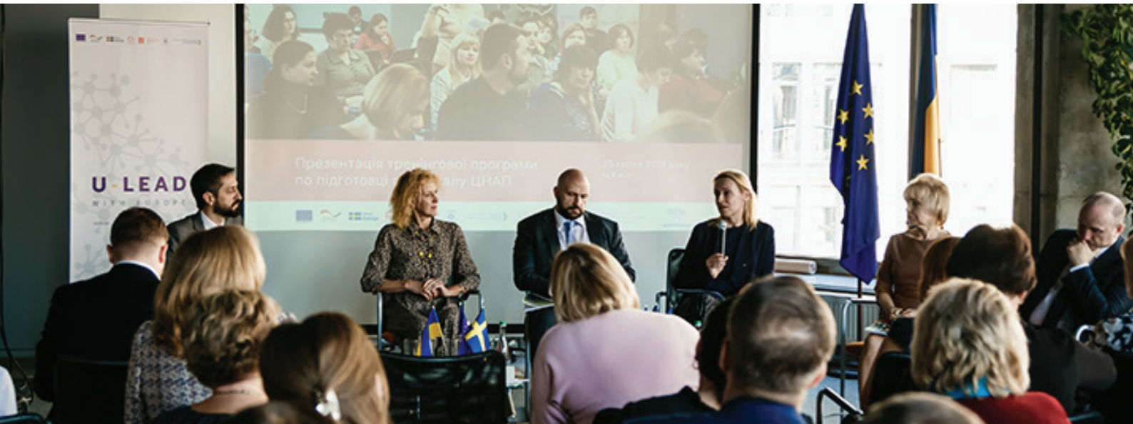
Презентація тренінгової програми з покращення якості надання адмінпослуг для населення Програми «U-LEAD з Європою».